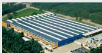
Hörmann Genk NV, België