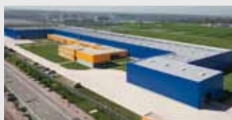
Hörmann Tianjin, China