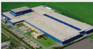
Hörmann KG Ichtshausen, Duitsland