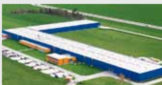
Hörmann Legnica Sp. z o.o., Polen