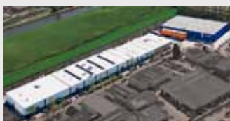
Hörmann Alkmaar B.V., Nederland