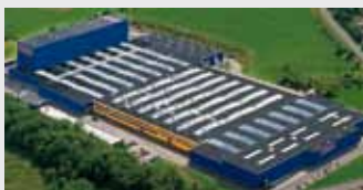
Hörmann KG Freisen, Duitsland