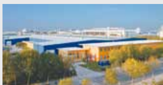
Hörmann Beijing, China