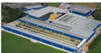
Hörmann KG Brockhagen, Duitsland