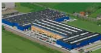
Hörmann KG Werne, Duitsland