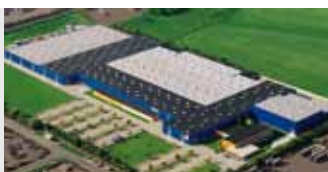
Hörmann KG Brandis, Duitsland