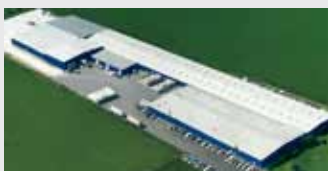
Hörmann LLC, Montgomery IL, USA