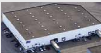
Hörmann Flexon, Leetsdale PA, USA

De Hörmann-groep biedt, als enige fabrikant op de internationale markt, alle belangrijke bouwelementen uit één hand. Ze worden in hooggespecialiseerde fabrieken vervaardigd volgens de nieuwste stand van de techniek. Door het overkoepelende verkoops- en servicenet in Europa en de aanwezigheid in Amerika en China is Hörmann uw sterke internationale partner voor hoogwaardige bouwelementen. In een kwaliteit zonder compromissen.